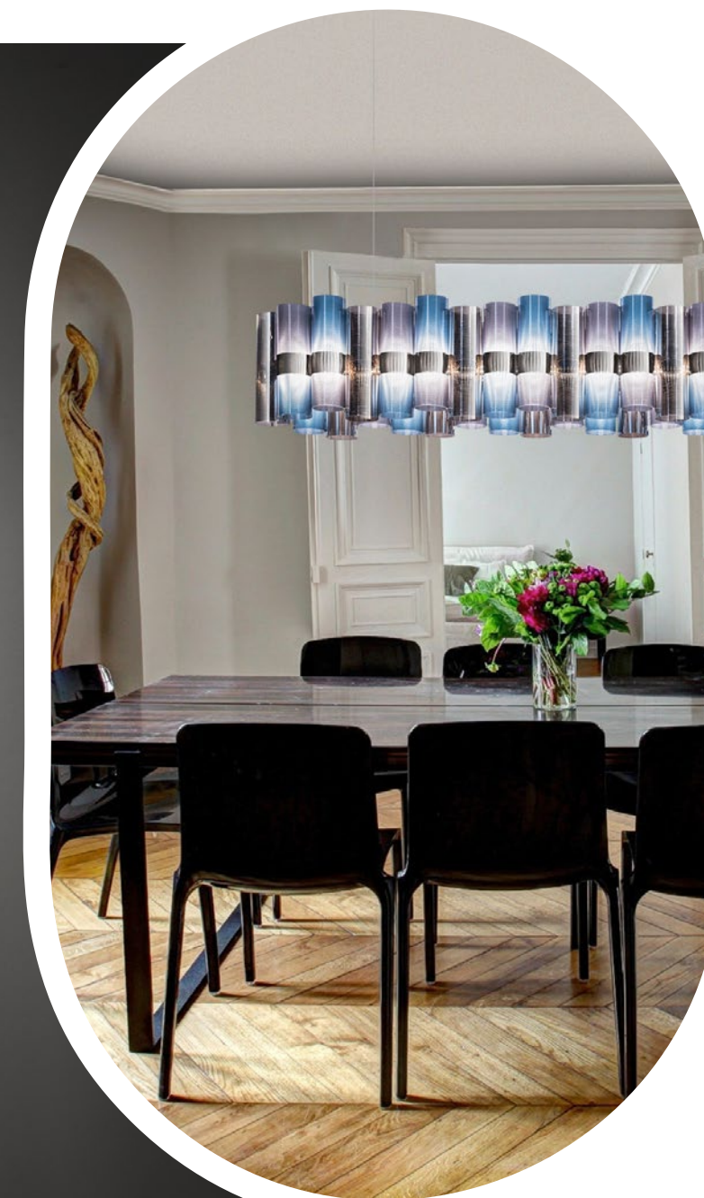
La Lollo Linear 140 Gradient

Linear 140: 110W - 110~240Vac/24Vdc, 12.420 Lumen - 2700 Kelvin. Dimmable with: PWM, 0-10 or Potentiometer (110V Triac).