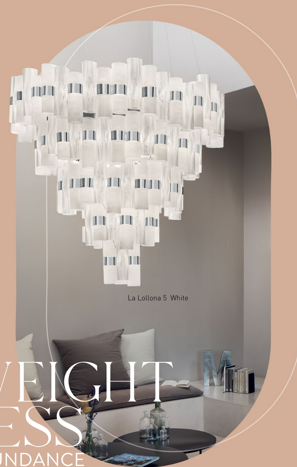
La Lollona 5 White

La Lollona arrives in superflat packaging weighing only 30 kg; easy to install, extraordinary to admire! Imballo superflat e peso massimo di 30 kg: La Lollona è facile da installare, straordinaria da ammirare!