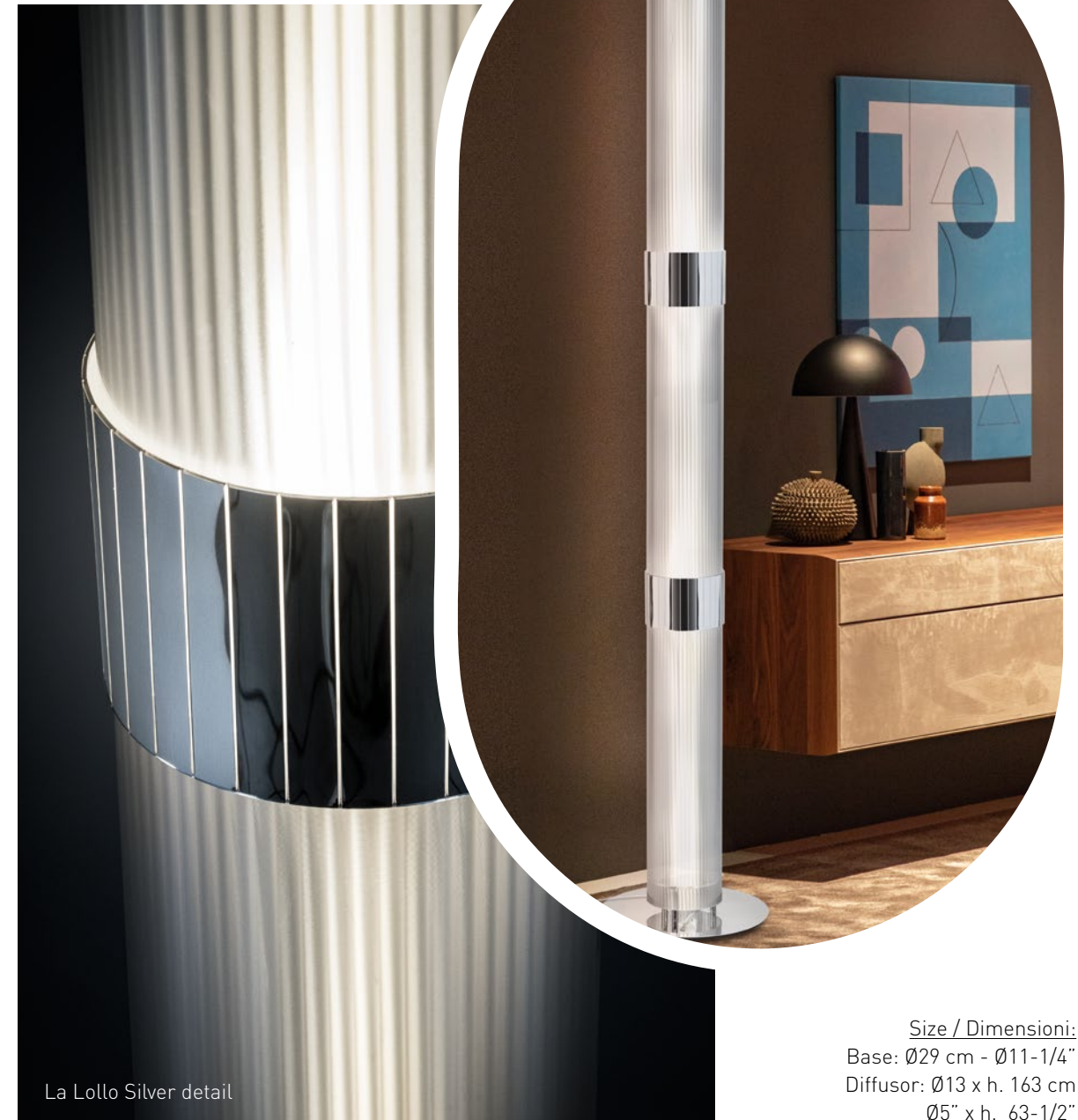
La Lollo Silver detail

Size / Dimensioni: Base: Ø29 cm - Ø11-1/4" Diffusor: Ø13 x h. 163 cm Ø5" x h. 63-1/2"