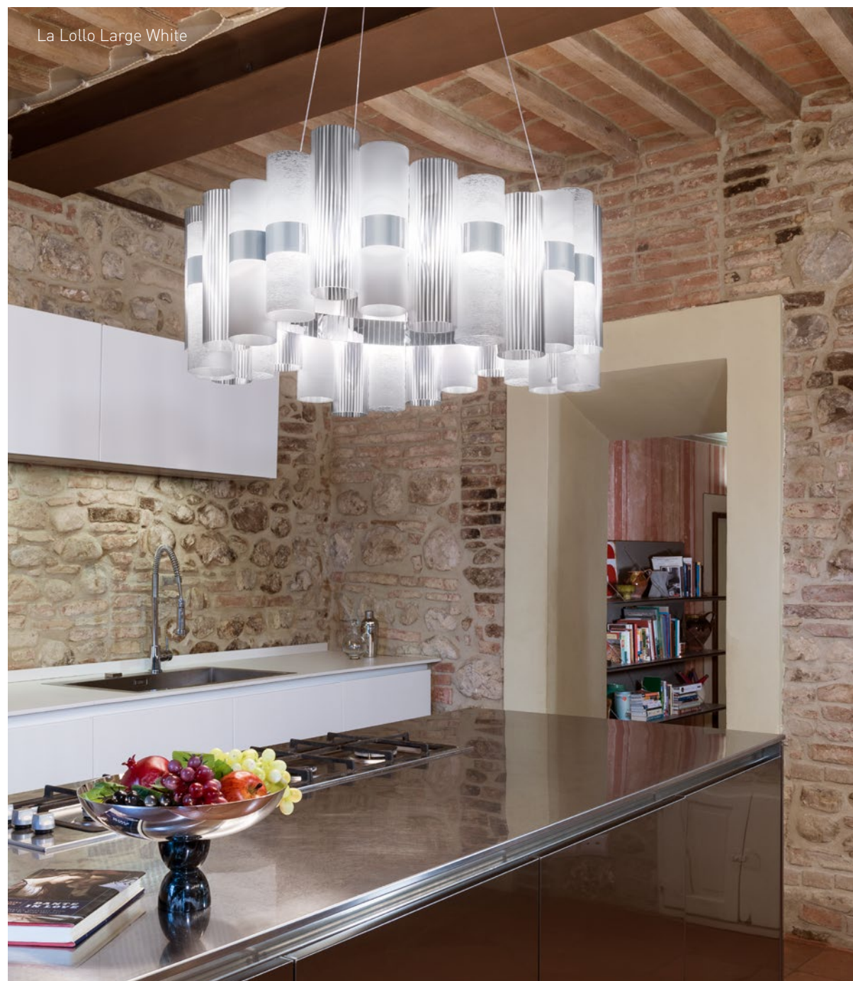
La Lollo Large White

The technopolymer cylinders alternate around a central LED illuminated ring. Una serie di cilindri di tecnopolimeri, infrangibili e leggeri sono disposti intorno ad un anello di luce a LED.