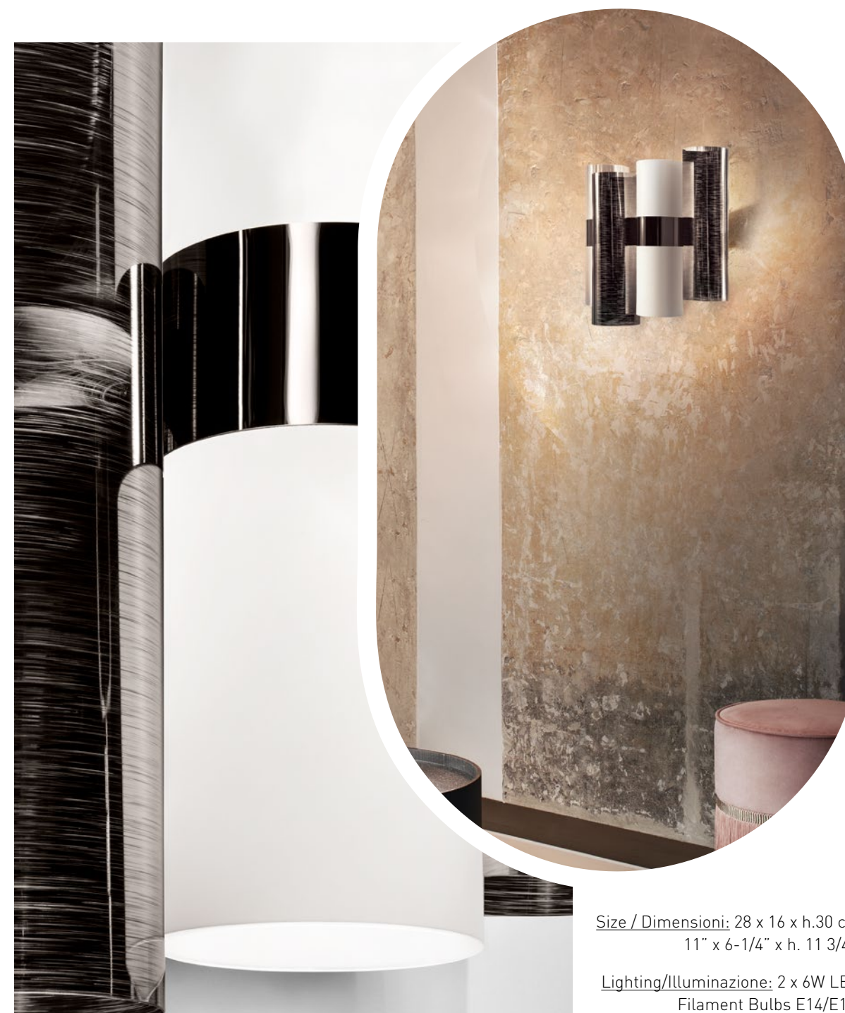
La Lollo Pewter/White

Size / Dimensioni: 28 x 16 x h.30 cm 11" x 6-1/4" x h. 11 3/4".