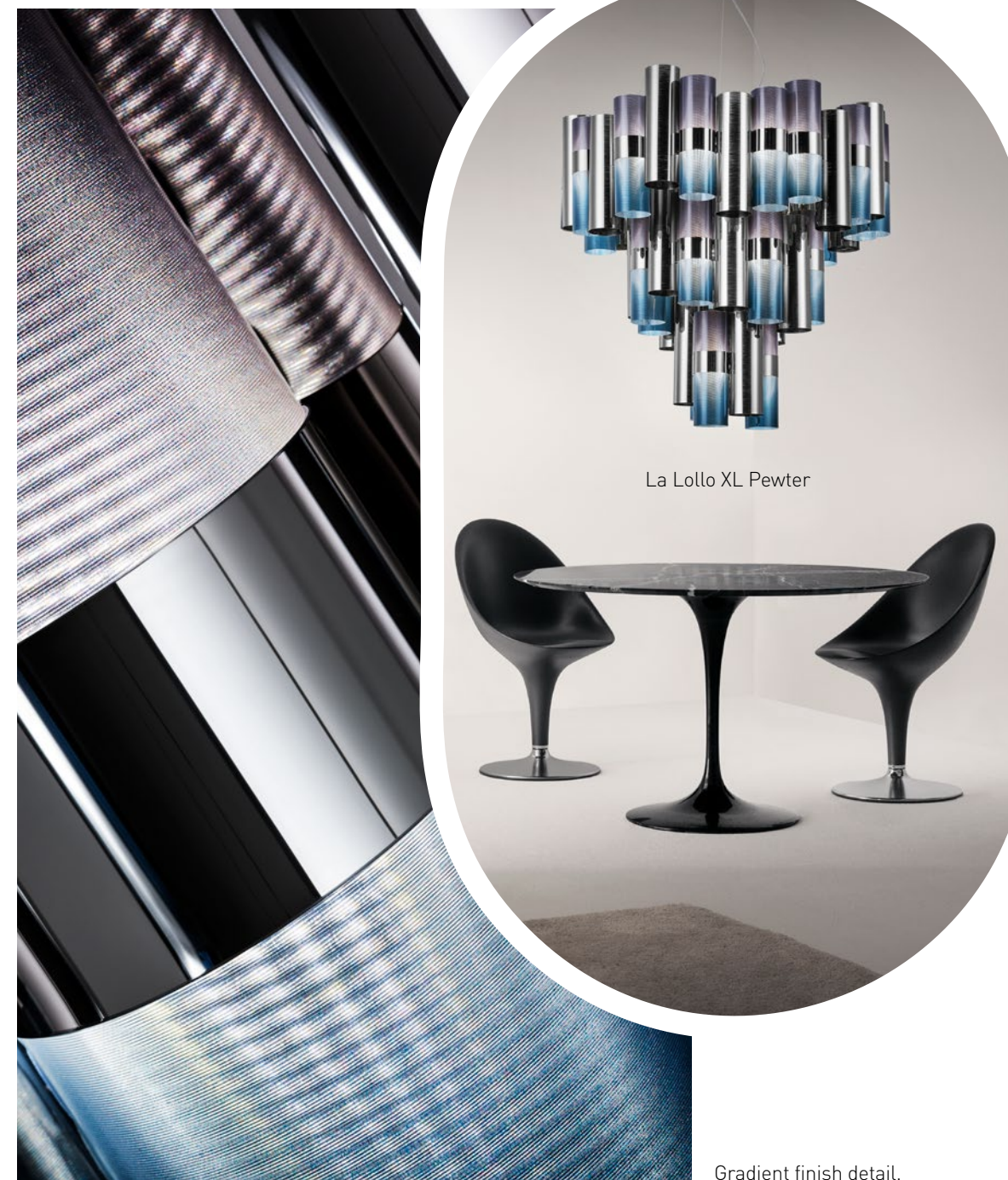
La Lollo XL Pewter

The technopolymer cylinders alternate around a central LED illuminated ring. Una serie di cilindri di tecnopolimeri, infrangibili e leggeri sono disposti intorno ad un anello di luce a LED.