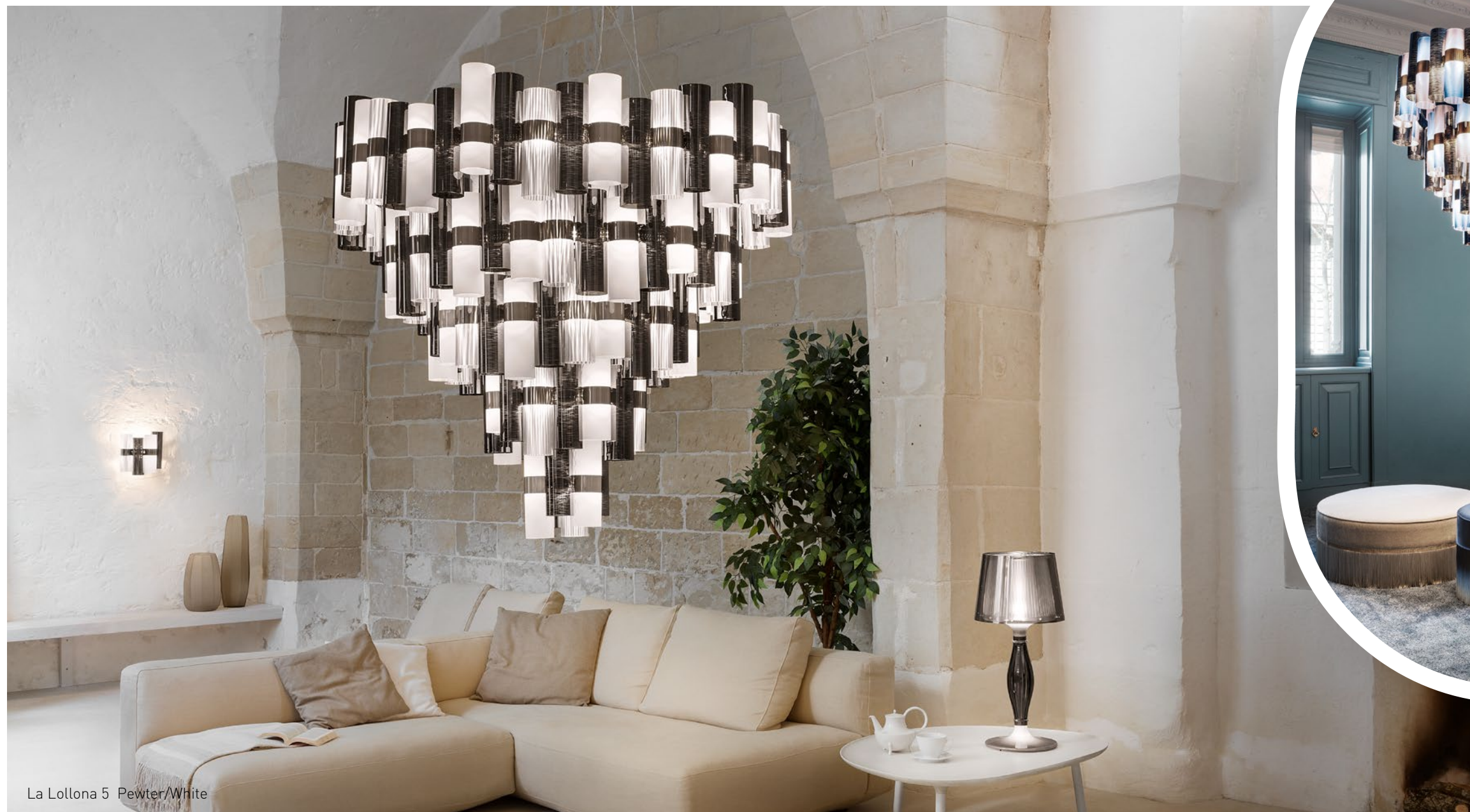
La Lollona 5 Pewter/White