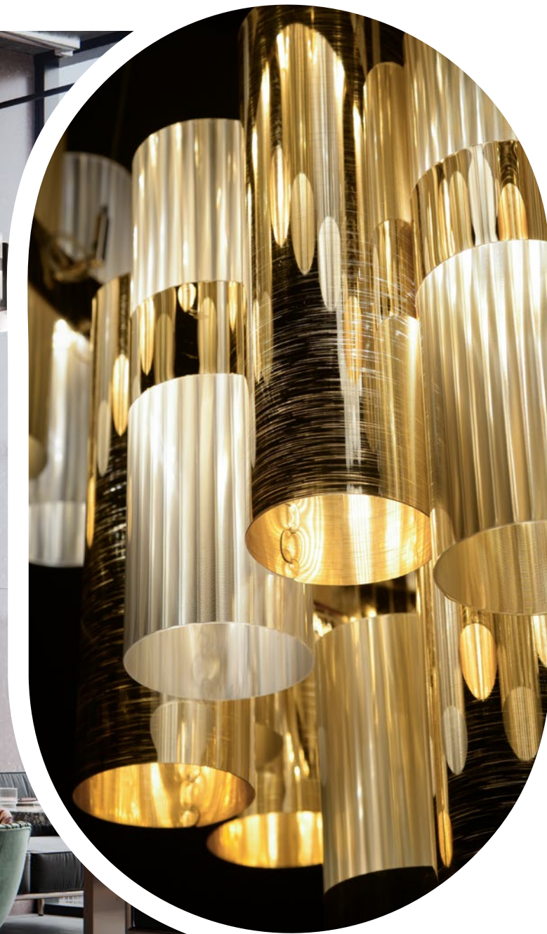
Gold finish detail.

Diameter and number of rings can be personalized. Pictured: a custom version of La Lollo gradient of Ø160 cm x h. 35 cm. Il diametro di La Lollo è personalizzabile in base alle esigenze, nella foto versione custom gradient di Ø160 cm x h. 35 cm.