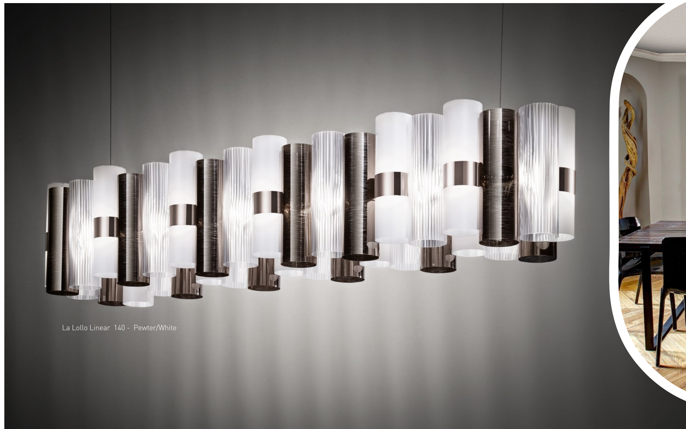
La Lollo Linear 140 - Pewter/White