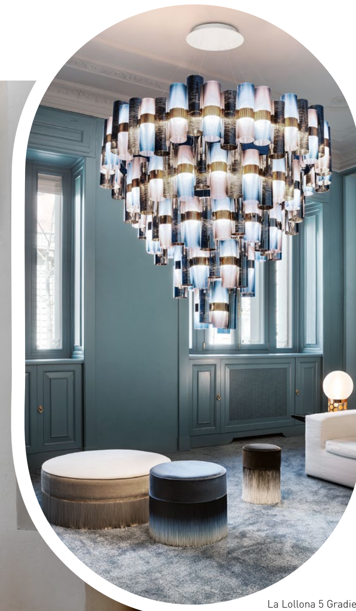
La Lollona 5 Gradient

A soft finish that was inspired by modern fabric textures.