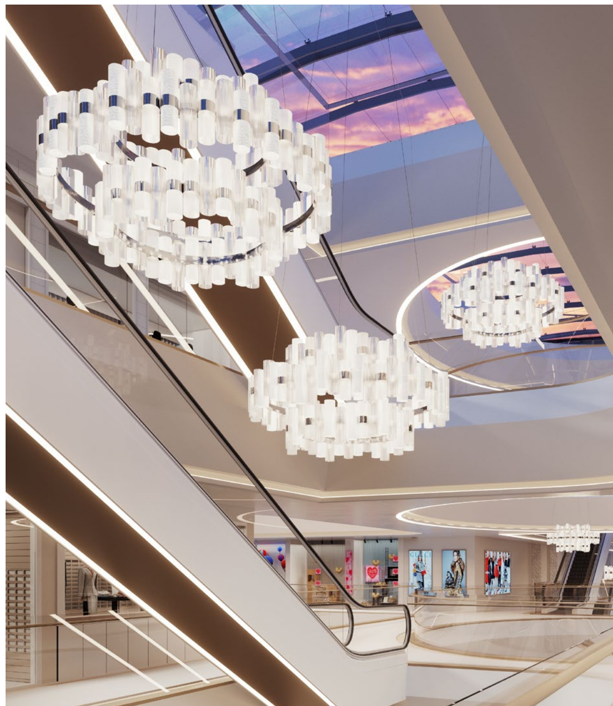
The suspension's color and size can be customized by request to fit large scale installations. This page: a custom version of 3 different rings, white finish: Ø156 cm x h. 85 cm. Next Page: a custom version, gold finish Ø100 cm x h.170 cm. Customizzabile su richiesta – sia nei colori che nelle taglie - per progetti di larga scala. In questa pagina: una versione con 3 differenti livelli con finitura white di Ø156 cm x h. 85 cm. Nella pagina successiva una versione personalizzata in gold di Ø100 cm x h.170 cm