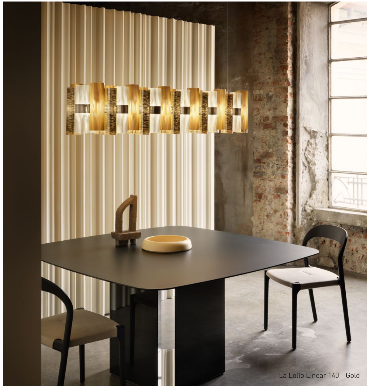
La Lollo Linear 140 - Gold