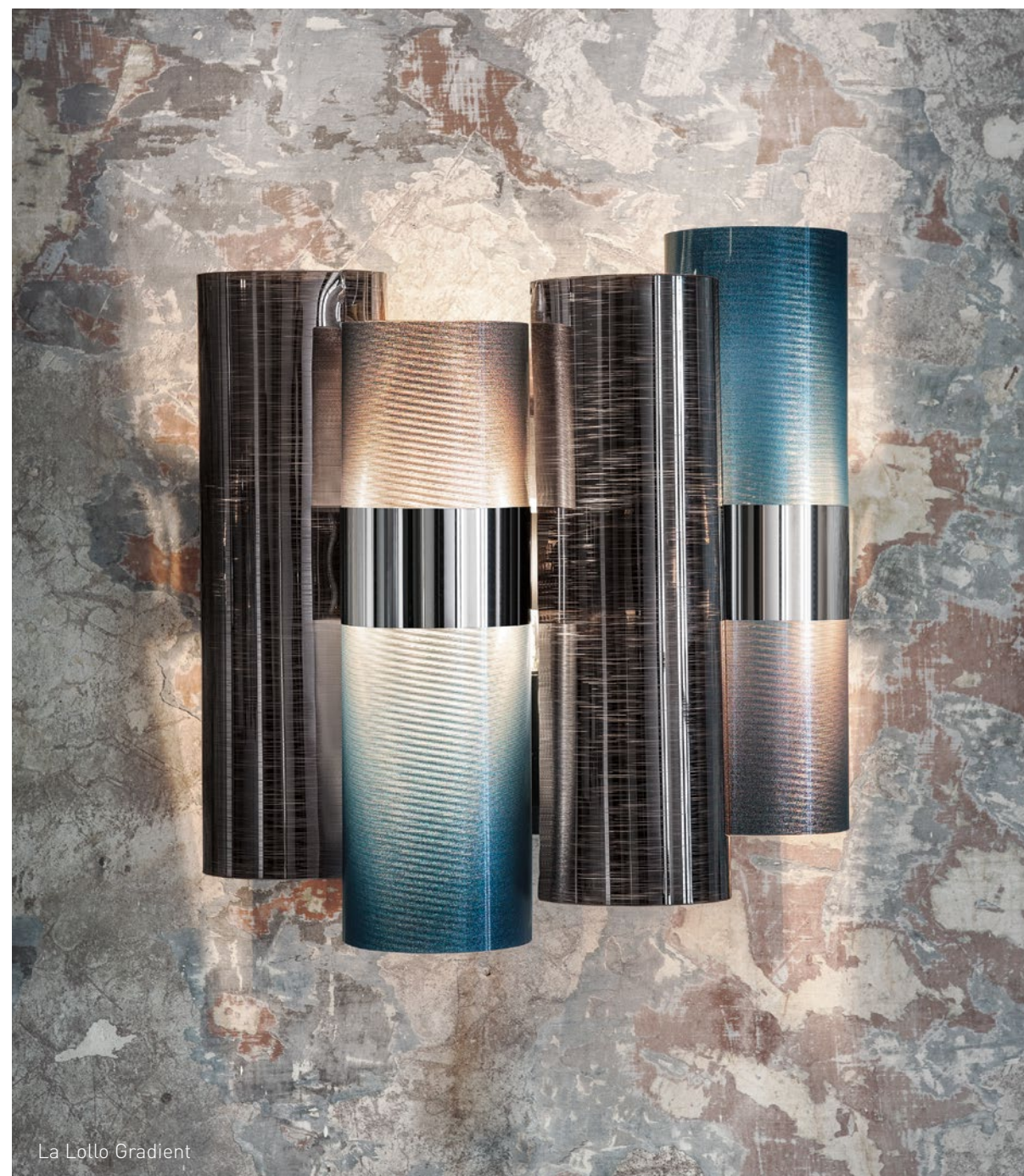
La Lollo Gradient