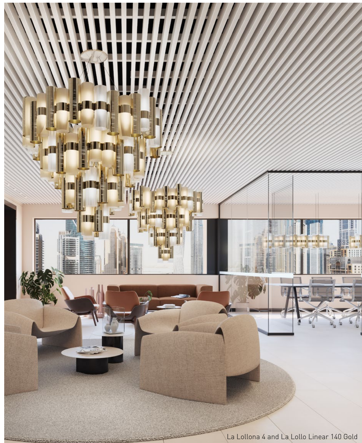
La Lollona 4 and La Lollo Linear 140 Gold

La Lollona arrives in superflat packaging weighing only 30 kg; easy to install, extraordinary to admire! Imballo superflat e peso massimo di 30 kg: La Lollona è facile da installare, straordinaria da ammirare!