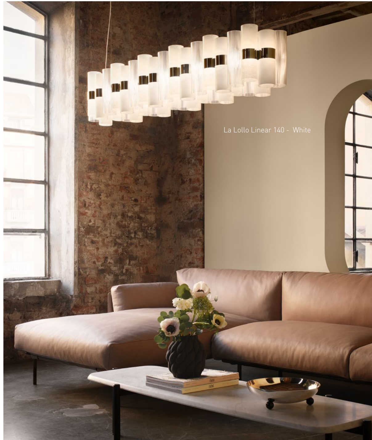
La Lollo Linear 140 - White