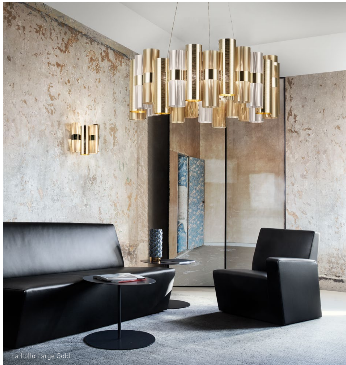
La Lollo Large Gold