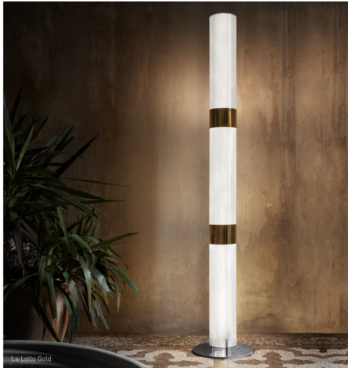
La Lollo Gold