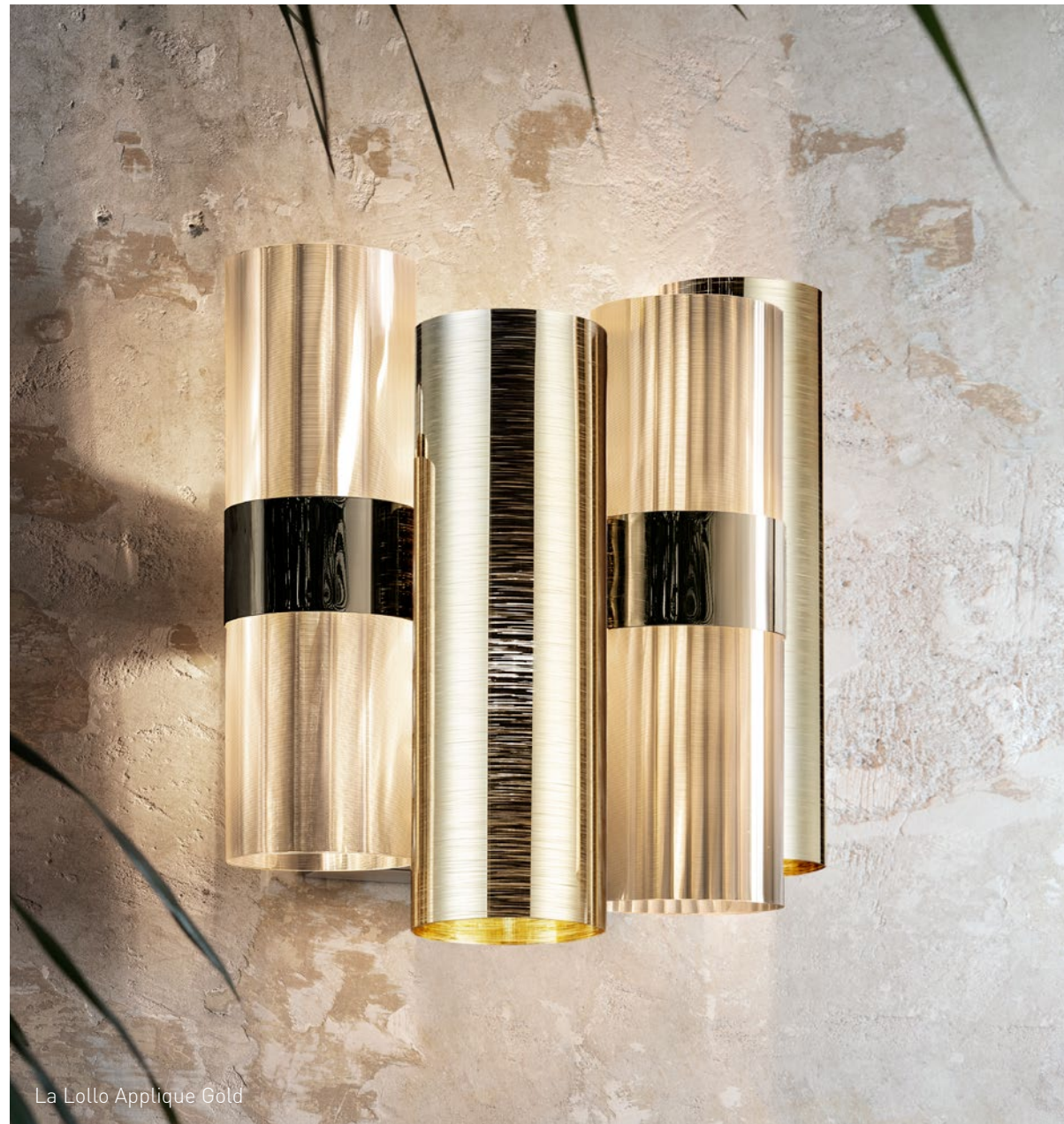
La Lollo Applique Gold